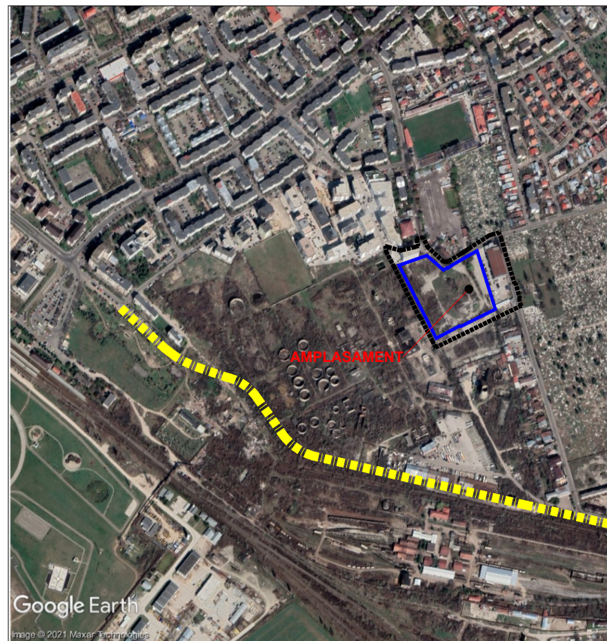
INCADRARE IN ZONA 1:10000